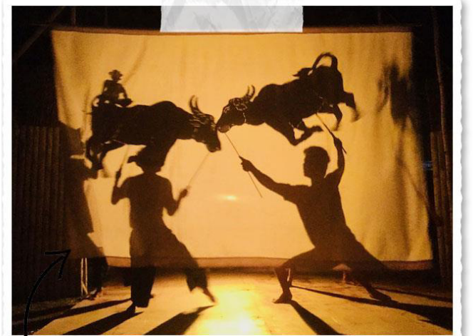
LE SBEK THOM CÔTÉ SPECTATEUR