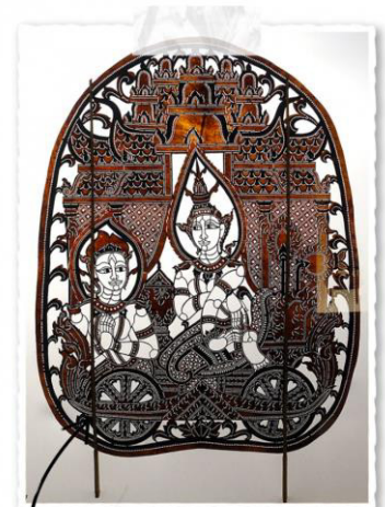
UNE FIGURINE DE SBK THOM

Les marionnettes du théâtre d'ombres sont taillées dans une seule pièce de cuir fabriqué à partir de peau de vache. Le cuir est tout d'abord teinté à l'aide d'une solution provenant d'écorce d'un arbre appelé « kandaol ».