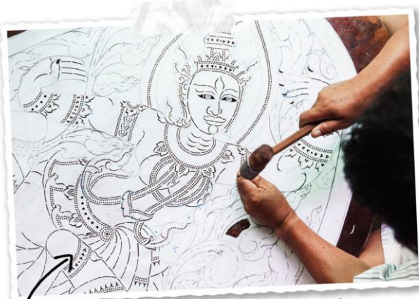
LA FABRICATION MINUTIEUSE D'UNE FIGURINE DE SBEK THOM

Ensuite, les artisans dessinent la figurine sur le cuir teinté, puis le cisèlent et le peignent avant de la fixer sur deux tiges de bambou qui permettront aux manipulateurs d'animer la figurine. La confection manuelle, très méticuleuse, de marionnettes peut durer jusqu'à 20 jours.