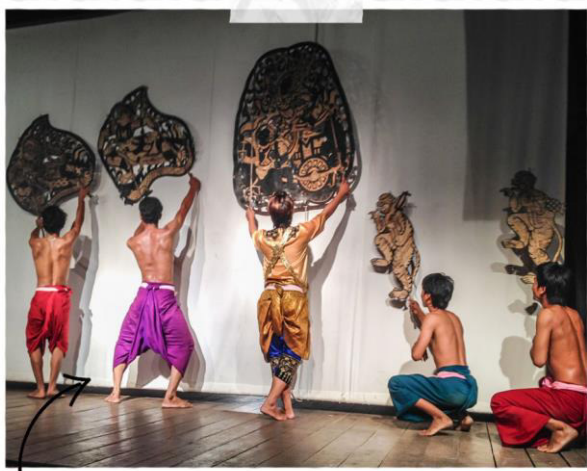
LE SBEK THOM VU DEPUIS LES COULISSES

Les figurines de Sbek Thom sont grandes, de 1 à 2m de haut, et non articulées. dans lesquelles les personnages sont ciselés dans un cadre. Les représentations ont toujours lieu en plein air à la tombée de la nuit. L'ombre de la silhouette de la marionnette est projetée sur un écran blanc à l'aide d'un grand feu, tandis que le manipulateur leur donne vie en effectuant des pas de danses précis et spécifiques